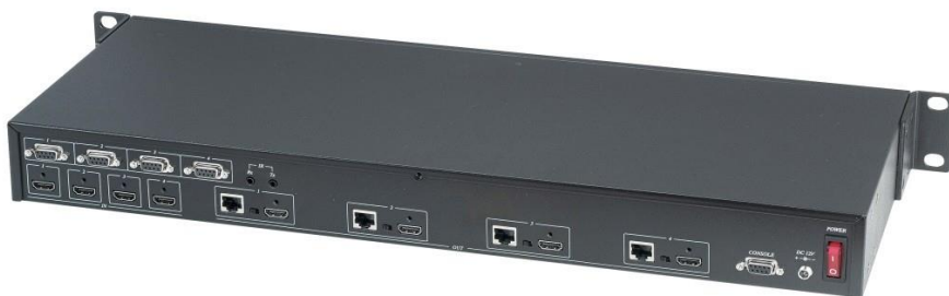
Рис. 2 Вид сзади HE04M