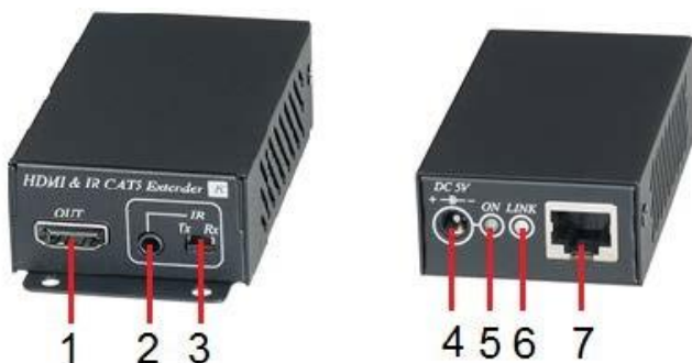
Рис. 7 Элементы коммутатора HE02EIR