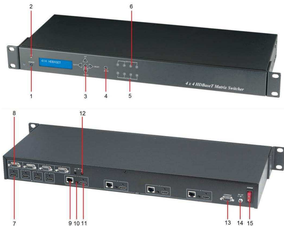
Рис. 5 Элементы коммутатора HE04M