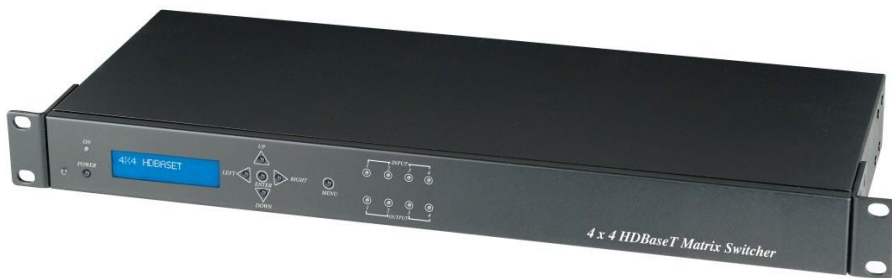
Рис.1 Вид спереди HE04M