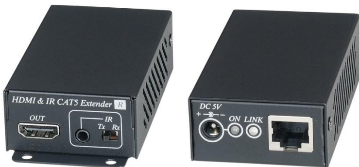
Рис. 4 Внешний вид HE02EIR