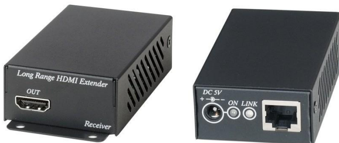
Рис. 3 Внешний вид HE02ER