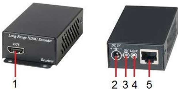
Рис. 6 Элементы коммутатора HE02ER