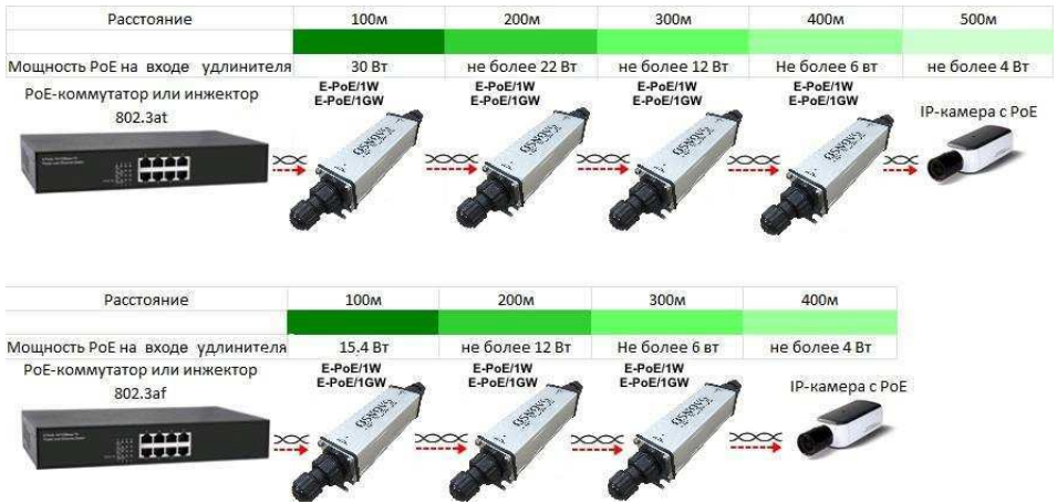
Рис.5 Зависимость передаваемой мощности PoE от расстояния для удлинителей E-PoE/1W, E-PoE/1GW