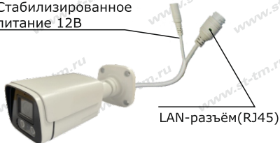
Рис.1 Схема подключения видеокмеры