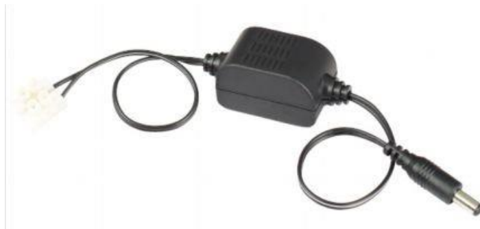
Рис.1 Внешний вид PC500