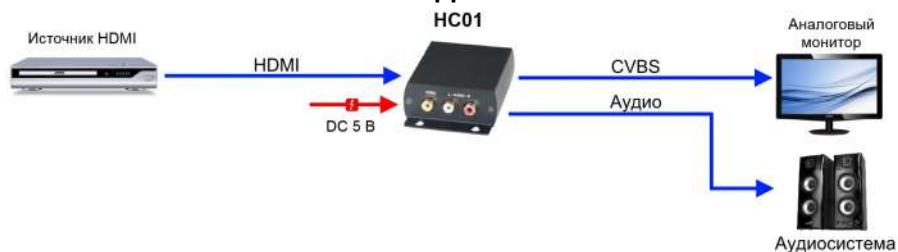
Рис.3 Схема подключения HC01