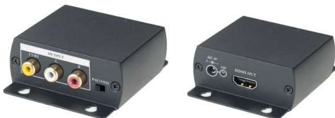
Рис.1 Преобразователь HC01, внешний вид