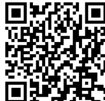
Прошивки и утилиты