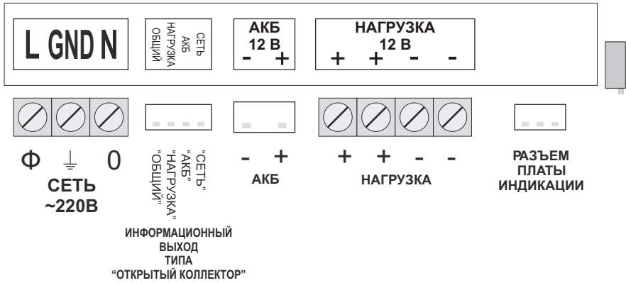
СХЕМА ИНФОРМАЦИОННОГО ВЫХОДА