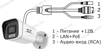
Рис.1 Схема подключения видеокамеры