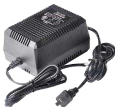
TEAC-66-243000V (EU) МКАС-66-243000U (USA) TEAC-66-243000VB (UK) Блок питания (модель для установки снаружи помещений)