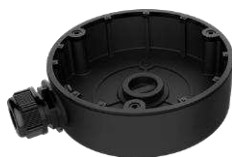
DS-1280ZJ-DM8(Black) Монтажная коробка