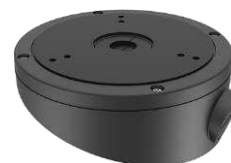
DS-1281ZJ-M(Black) Монтажная коробка для потолочной установки под углом