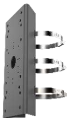
DS-1275ZJ-SUS(Black) Кронштейн для установки на столб (стойку)