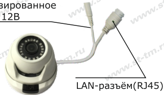
Рис.1 Схема подключения видеокмеры