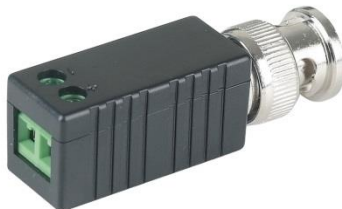
Рис.1 Приёмопередатчик ТТР111HD