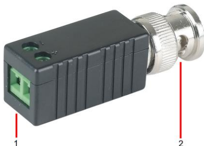
Рис. 2 Приёмопередатчик TTP111HD, разъемы