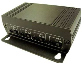
Рис. 2 Вид сзади приёмопередатчика IE01