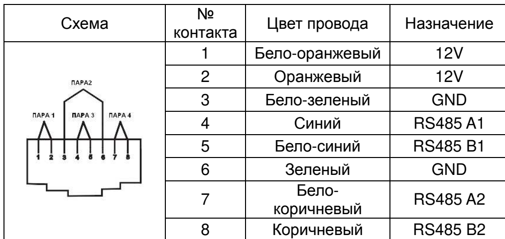
Табл.3 Распайка разъема RJ45 кабеля витой пары.

Рекомендуем использовать кабель витой пары UTP CAT5e/CAT6.