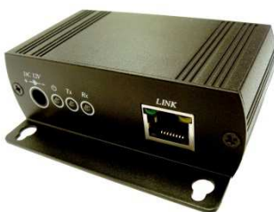
Рис. 1 Вид спереди приёмопередатчика IE01