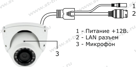
Рис. 1 Схема подключения видеокamеры