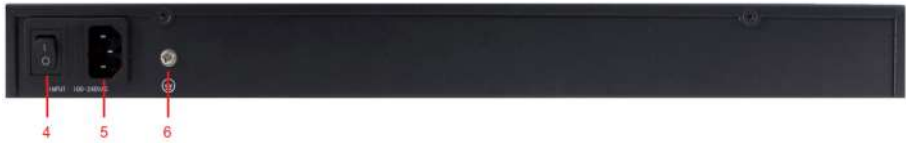
Рис. 6 Задняя панель инжекторов