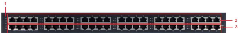
Рис. 5 Передняя панель Midspan-24/370RG