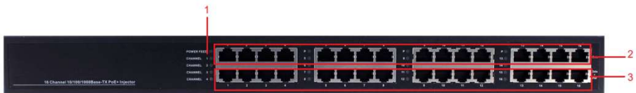
Рис. 4 Передняя панель Midspan-16/250RG