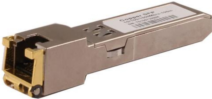
Рис.1 SFP-модули SFP-TP-RJ45, SFP-TP-RJ45/I, внешний вид