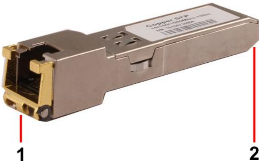
Рис. 2 SFP-модули SFP-TP-RJ45, SFP-TP-RJ45/I, разъемы