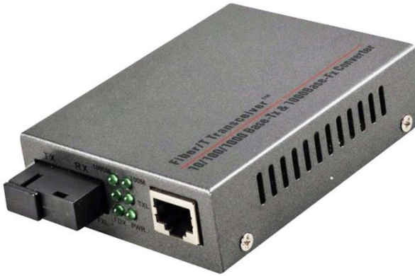
Рис. 1 Внешний вид медиаконвертеров OMC-1000-11S5a (OMC-1000-11S5b)