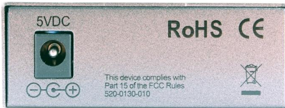
Рис.2 Вид сзади медиаконвертеров OMC-1000-11S5a (OMC-1000-11S5b)