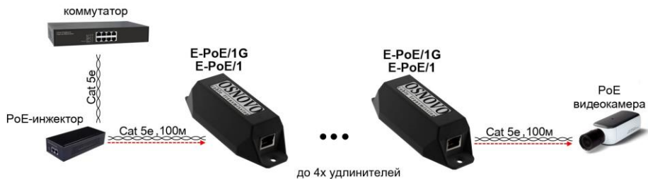
Рис. 6 Схема подключения удлинителей на примере модели E-PoE/1, E-PoE/1G