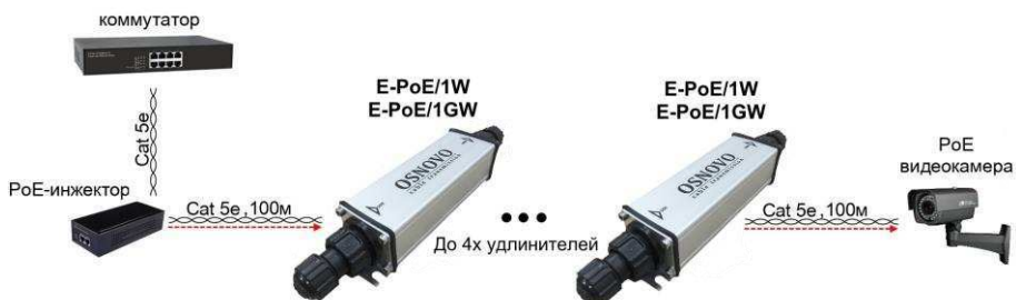
Рис. 7 Схема подключения удлинителей на примере модели E-PoE/1W, E-PoE/1GW