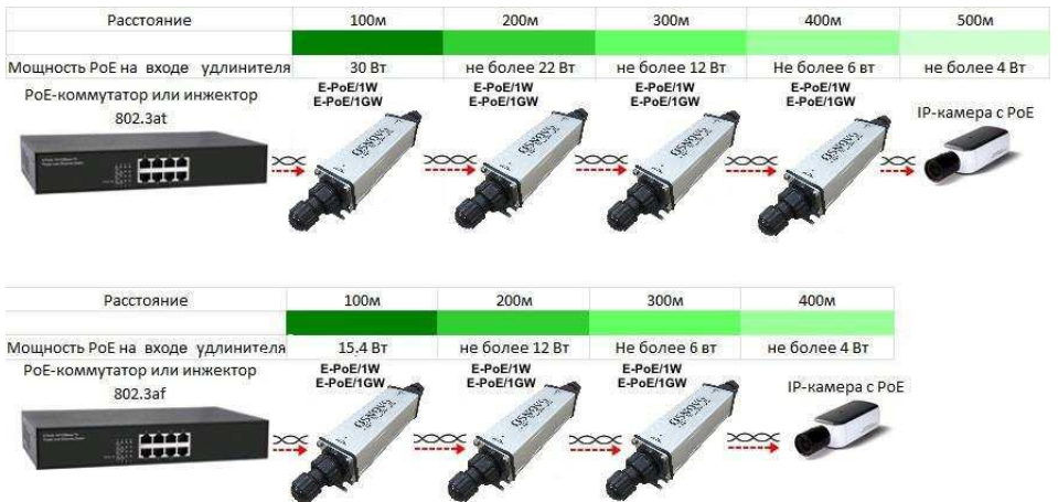
Рис.5 Зависимость передаваемой мощности PoE от расстояния для удлинителей E-PoE/1W, E-PoE/1GW