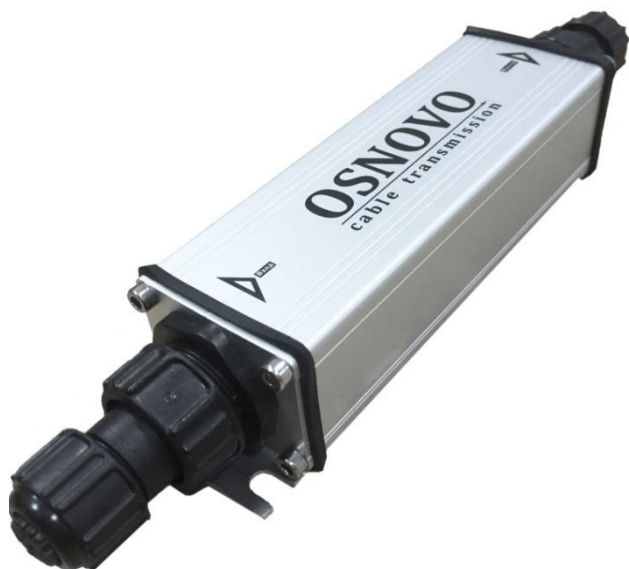
Рис.2 Удлинители E-PoE/1W, E-PoE/1GW, внешний вид