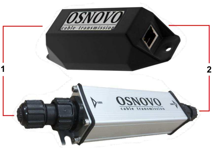
Рис.3 Удлинители E-PoE/1W, E-PoE/1GW, внешний вид