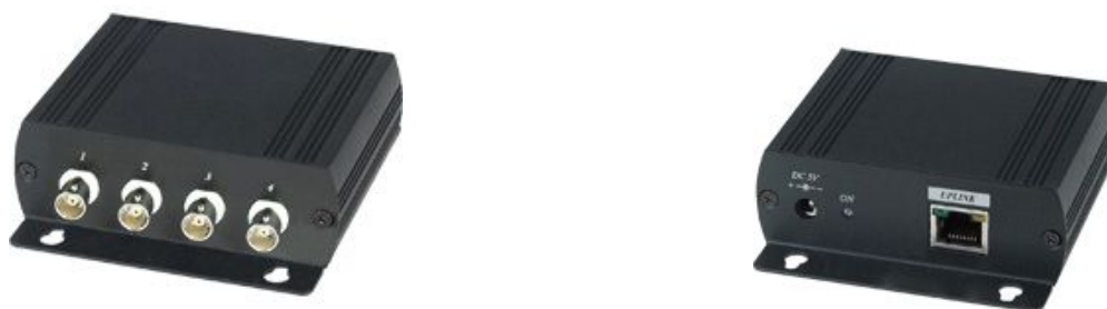
Рис.1 Внешний вид IP01H